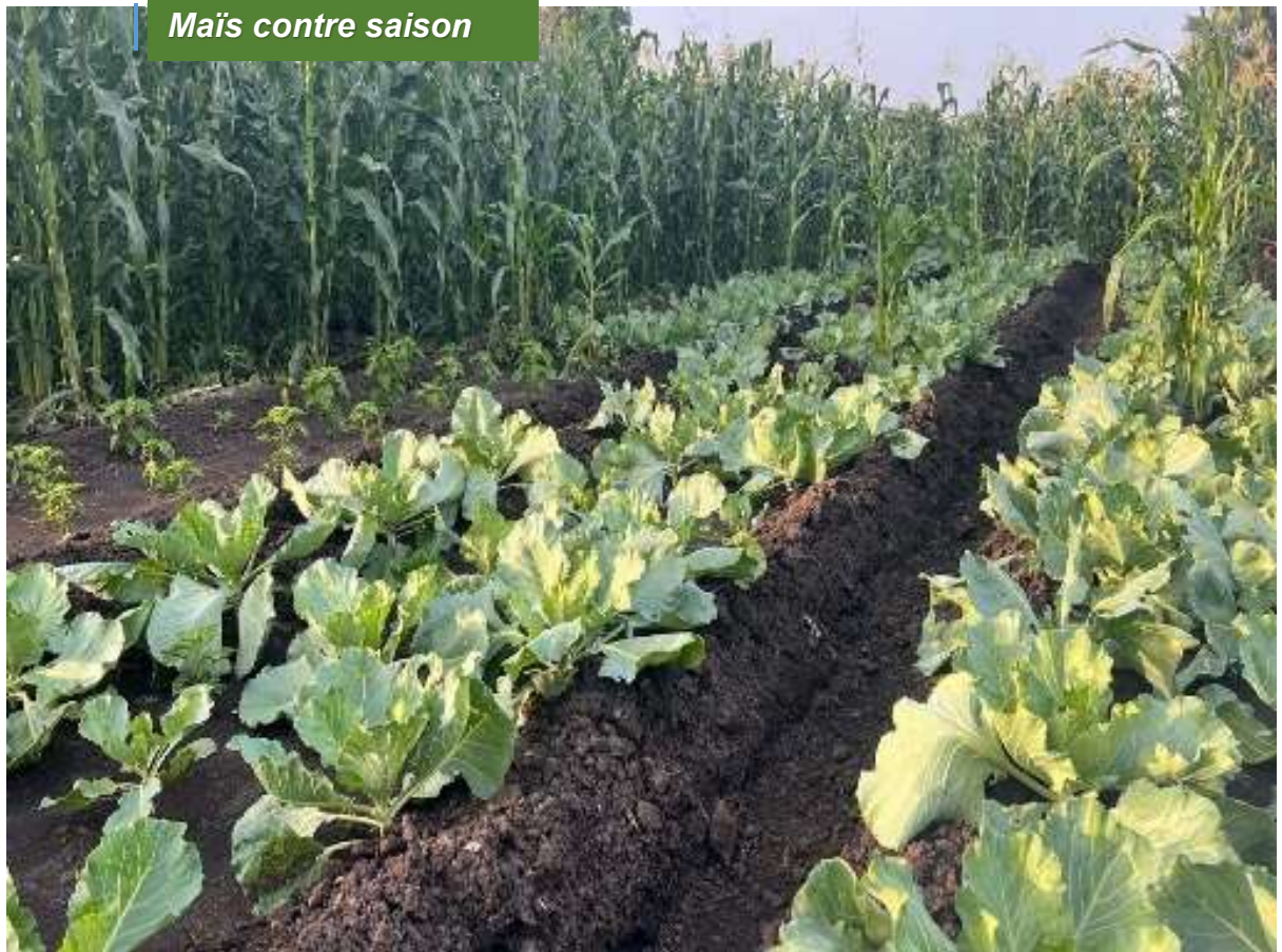
Maïs contre saison