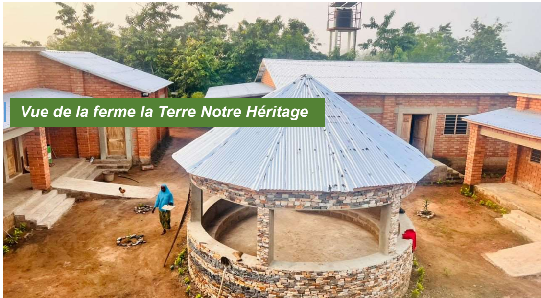
Vue de la ferme la Terre Notre Héritage