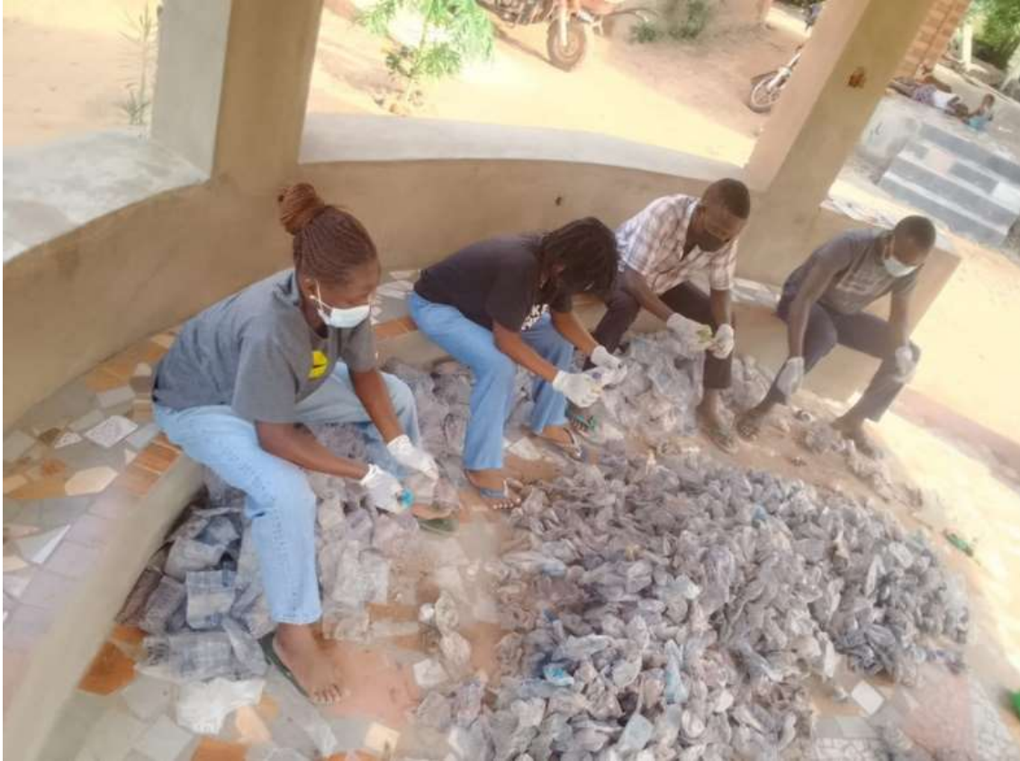
Préparation pépinière plan pour reboisement