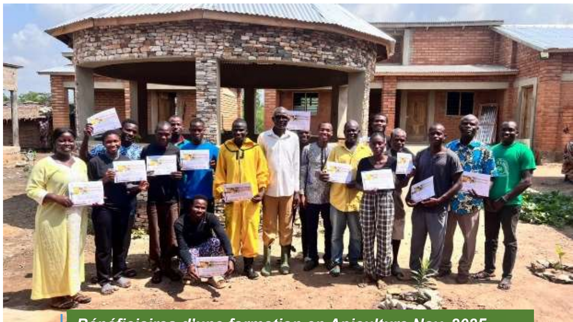
Bénéficiaires d'une formation en Apiculture Nov. 2025