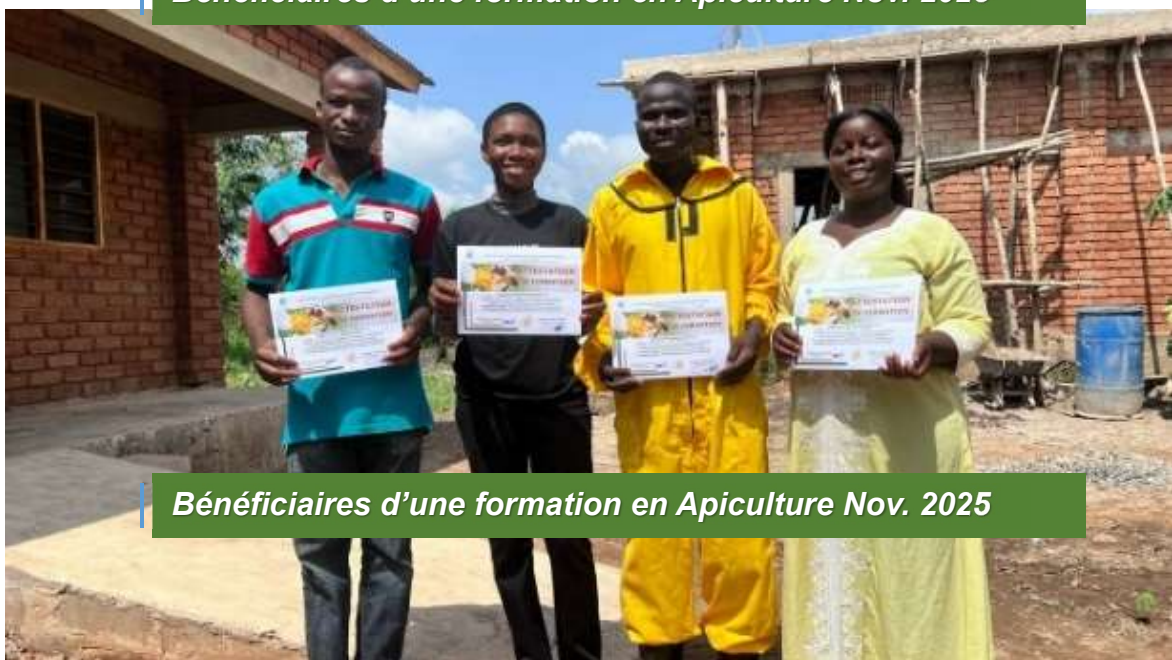
Bénéficiaires d'une formation en Apiculture Nov. 2025