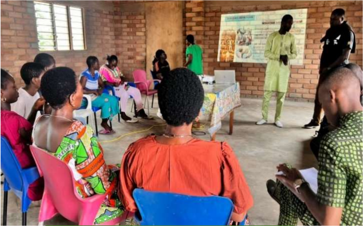
Formation transformation agroalimentaire Août 2025