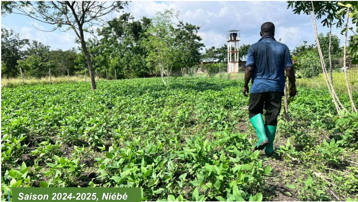
Saison 2024-2025, Niébé