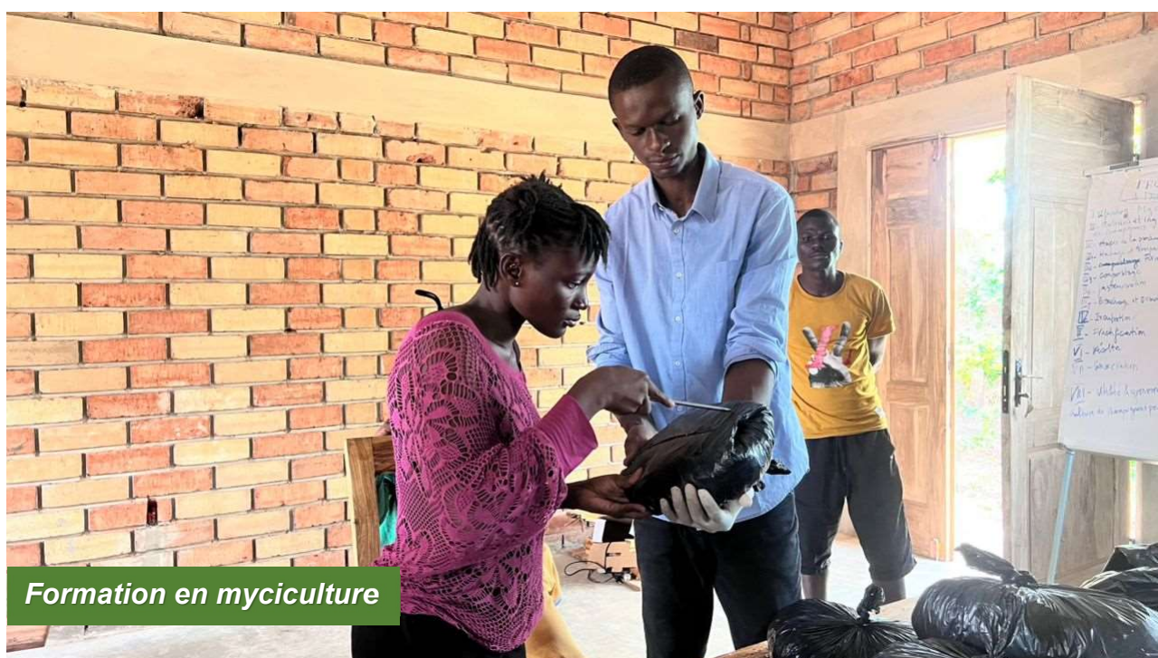
Formation en myciculture